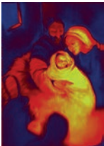
Licht der Welt 6216