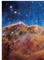
Im Anfang 6241

Weitere Motive: siehe unten und auf gottesdiensthilfen.de