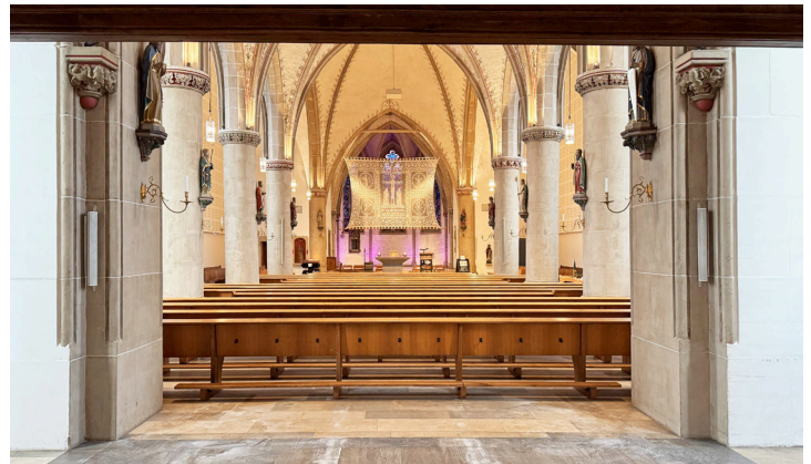
St. Dionysius, Nordwalde, Blick zum Altar (oben) und Blick zum Gestaltungsareal unter der Orgelempore

Die Teilnehmenden müssen die eingereichten Arbeiten selbst entworfen und ausgeführt haben. Arbeiten, die üblicherweise nur unter Mitwirkung anderer gestaltet werden können, müssen maßgeblich von den Teilnehmenden beeinflusst worden sein. Eine Teamarbeit bei Entwurf und Ausführung ist zulässig, muss jedoch auf der Teilnahmeerklärung vermerkt werden.